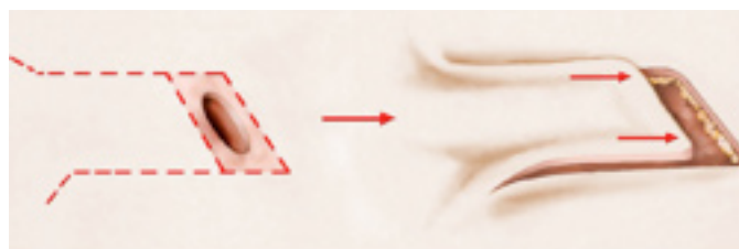
exemple de plastie locale : avancement d'un lambeau cutané

Dans les cas où la taille de la lésion ou sa localisation rendent irréalisable une fermeture par suture directe, la couverture de la zone retirée sera assurée soit par une greffe de peau prélevée sur une autre région, soit par une plastie locale qui correspond au déplacement d'un lambeau de peau avoisinant afin que celui-ci vienne recouvrir la perte de substance cutanée (cf schéma ci-après). La rançon cicatricielle de ce type de lambeau est bien sûr plus importante, mais, réalisé dans les règles de l'art, les résultats esthétiques à terme sont toutefois souvent meilleurs que ceux d'une greffe.